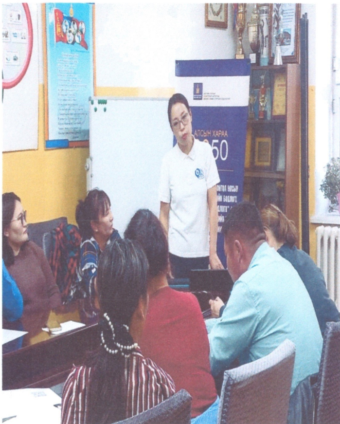
Төрийн цахим үйлчилгээний хэлтсээс 2023.10.23-ны өдөр зохион байгуулсан сургалт мэдээлэлд